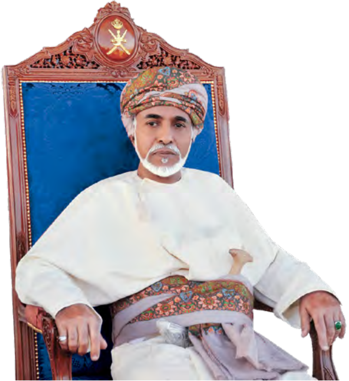
حضرة صاحب الجلالة السلطان قابوس بن سعيد المعظم