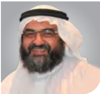
الشيخ د. أمين فاتح مقرر لجنة الرقابة الشرعية